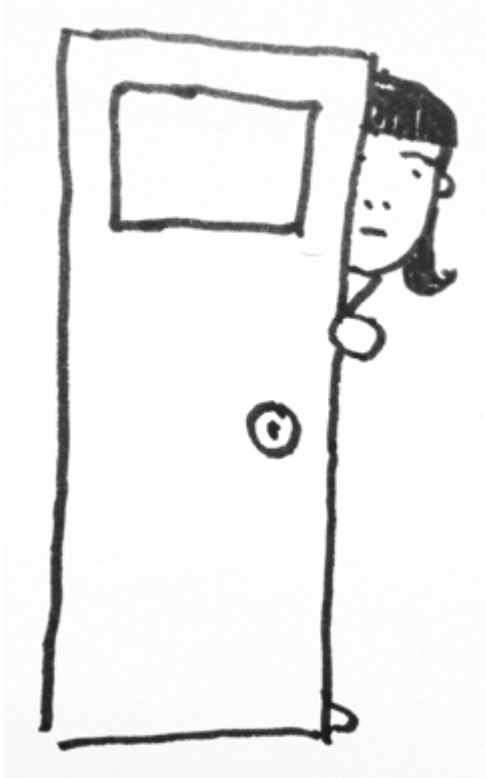
イメージキャラクター：半歩さん